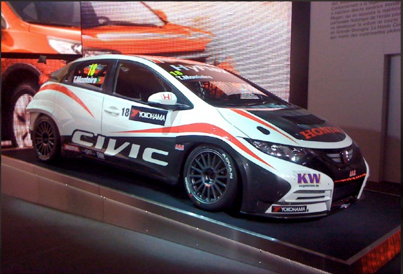
Honda Civic WTCC