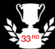
2012 MOTUL TITLES