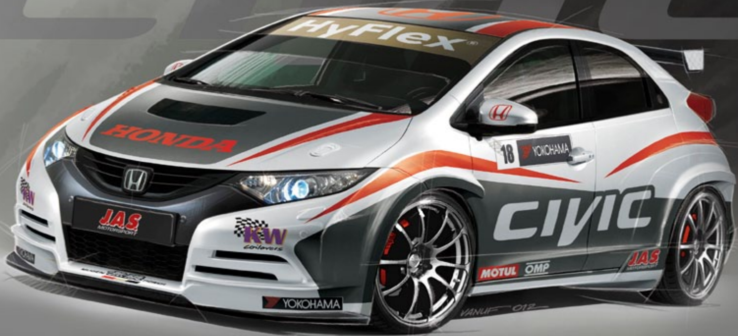
► Honda Civic WTCC