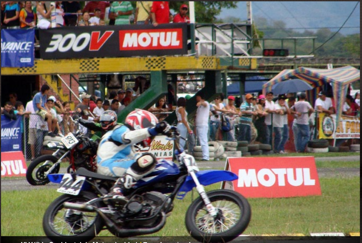
VI Válida Occidental de Motovelocidad / Zarzal racetrack