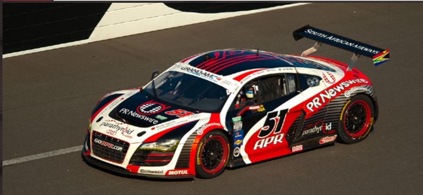
Jim Norman - Dion von Moltke / Audi APR Motorsport / Audi R8

Round 01 02 03 04 05 06 07 08 09 10 11 12 13