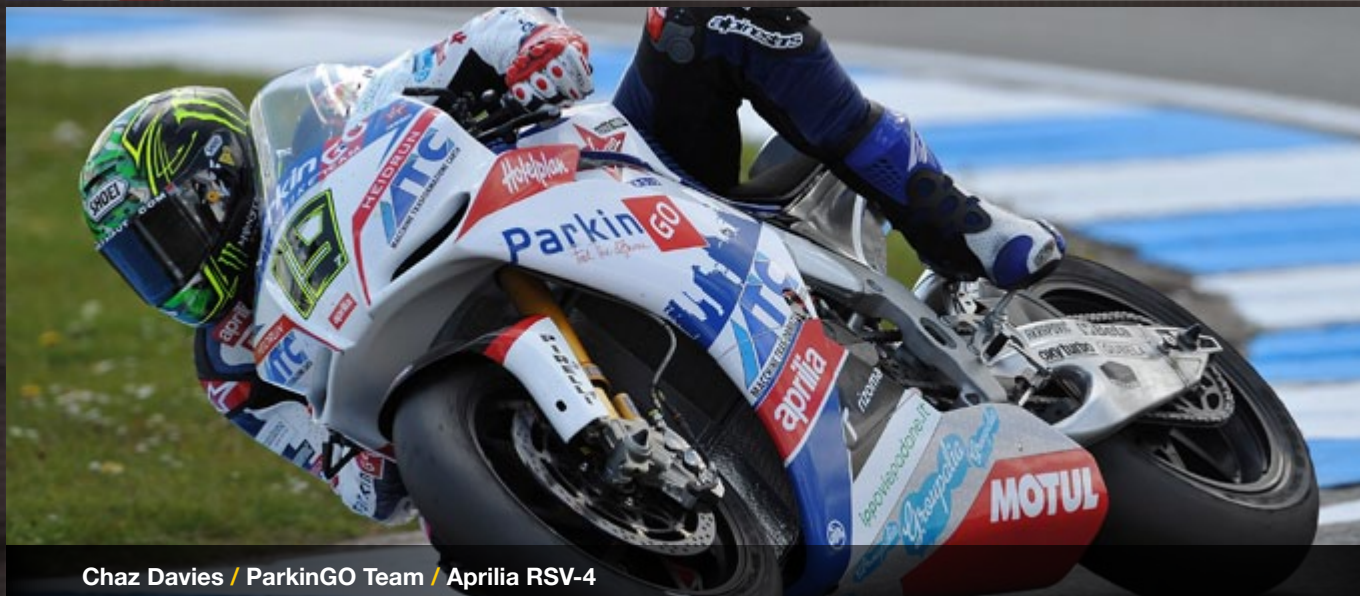
Chaz Davies / ParkinGO Team / Aprilia RSV-4

Round 01 02 03 04 05 06 07 08 09 10 11 12 13 14